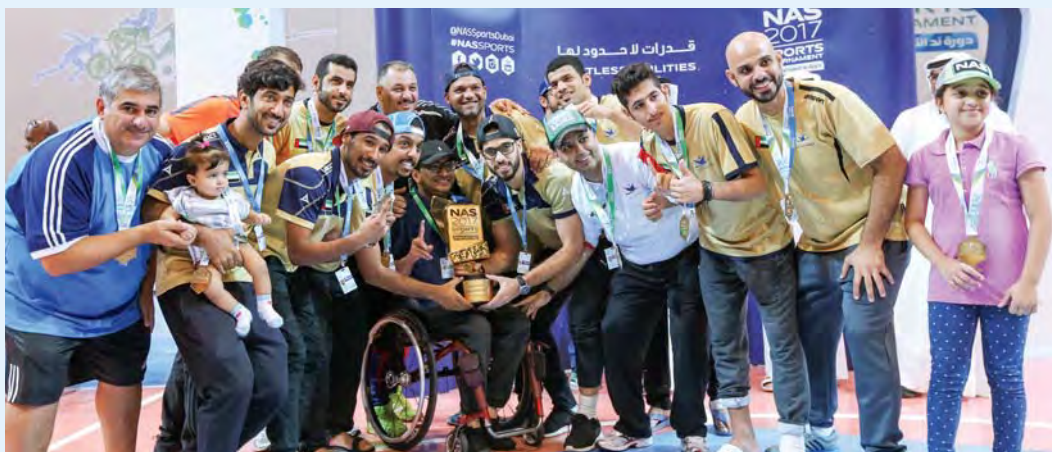
تتويح دبي بكأس أصحاب الإعاقة السمعية | البيان