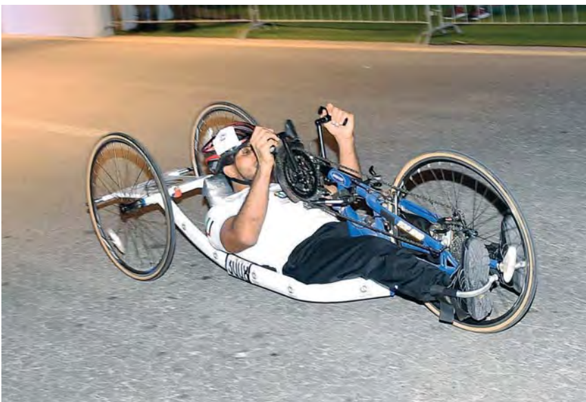
أصحاب الهمم في قلب الدورة | البيان

وتابع: «ساهمت الدورة في نشر وتطوير كرة قدم الصالات والكرة الطائرة من خلال استقطاب أفضل اللاعبين والحكام في العالم، كما زادت شعبية البادل تنس في الدولة عبر مشاركة أفضل المصنفين دولياً ومهدت هذه الشعبية لإنشاء اتحاد الإمارات للعبة».