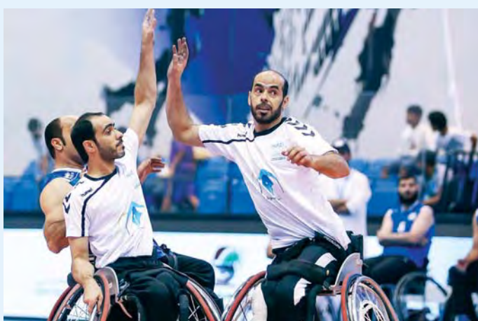
الياسي خلال المباراة

وأوضح قائد فريق نقوة أن المباراة النهائية جاءت قوية، مشيداً بالمستوى الجيد الذي ظهر به فريق النيابة العامة، مؤكداً أن فوز فريقه لم يكن سهلاً رغم الفارق الكبير في النتيجة.