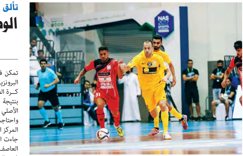
من مباراة الوصل والعاصفة