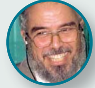
محمد شوقي الإسلامبولي

الملقب بشيخ الفتنة من مواليد المحلة الكبرى عام 1926، وأحد أبرز أئمة جماعة الإخوان الإرهابية، وصدر ضده حكم بالإعدام في مصر