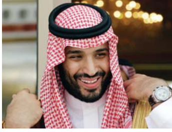
محمد بن سلمان ولياً للعهد السعودي