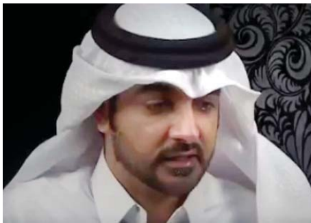
■ ضابط المخابرات القطري

وكانت اعترافات شفاهية ومصورة بثت للضابط قبل عامين في قضية الإساءة لرموز الدولة عبر مواقع التواصل والمعروفة إعلامياً بقضية «بوعسكور» عن تورط ذلك