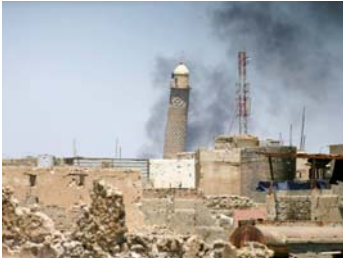
«داعش» يفجر جامع النوري في الموصل