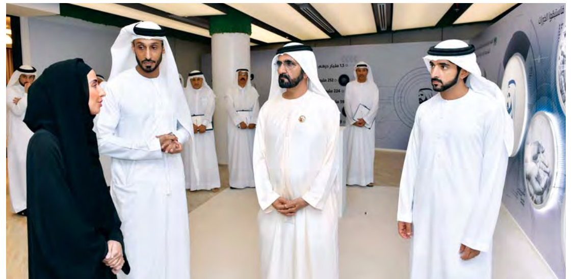
نائب رئيس الدولة وحمدان بن محمد وأحمد بن محمد ومحمد المر وحמיד القطامي وحسين لوتاه