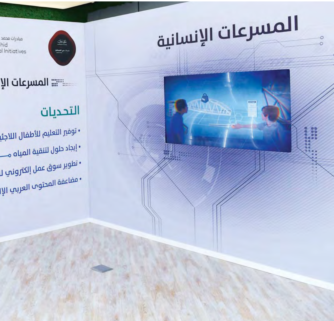
محمد بن راشد وحمدان بن محمد خلال إطلاق «المسرعات الإنسانية»