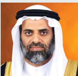
■ حمد الرحومي

وأضاف: إن سموه، يعمل بوتيرة تصاعديّة وسريعة جداً ودائماً يحثنا على تسريع الإنجازات، واليوم فإن المسرعات الإنسانية مشروع رائد سوف يكون له مردود طيب سينعكس على محلياً وإقليمياً وعالمياً، ويعزز مكانة الإمارات في مجال تقديم المساعدات الإنسانية والعمل الخيري. كما أن سموه يتابع شخصياً جميع المبادرات التي يطلقها ويوجه بتسريع تنفيذها بأقل من الوقت المخطط لها، والمطلوب تضافر الجهود لتحقيق رؤية سموه في تحسين حياة الناس من خلال تسخير التكنولوجيا الحديثة في هذا المجال الإنسان لخدمة البشرية.