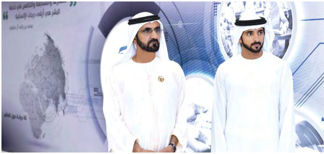
محمد بن راشد وحمدان بن محمد