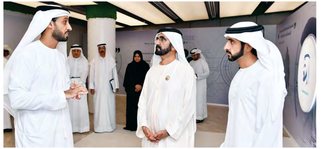
محمد بن راشد وحمدان بن محمد ومحمد المر وحמיד القطامي ورجاء القرقي