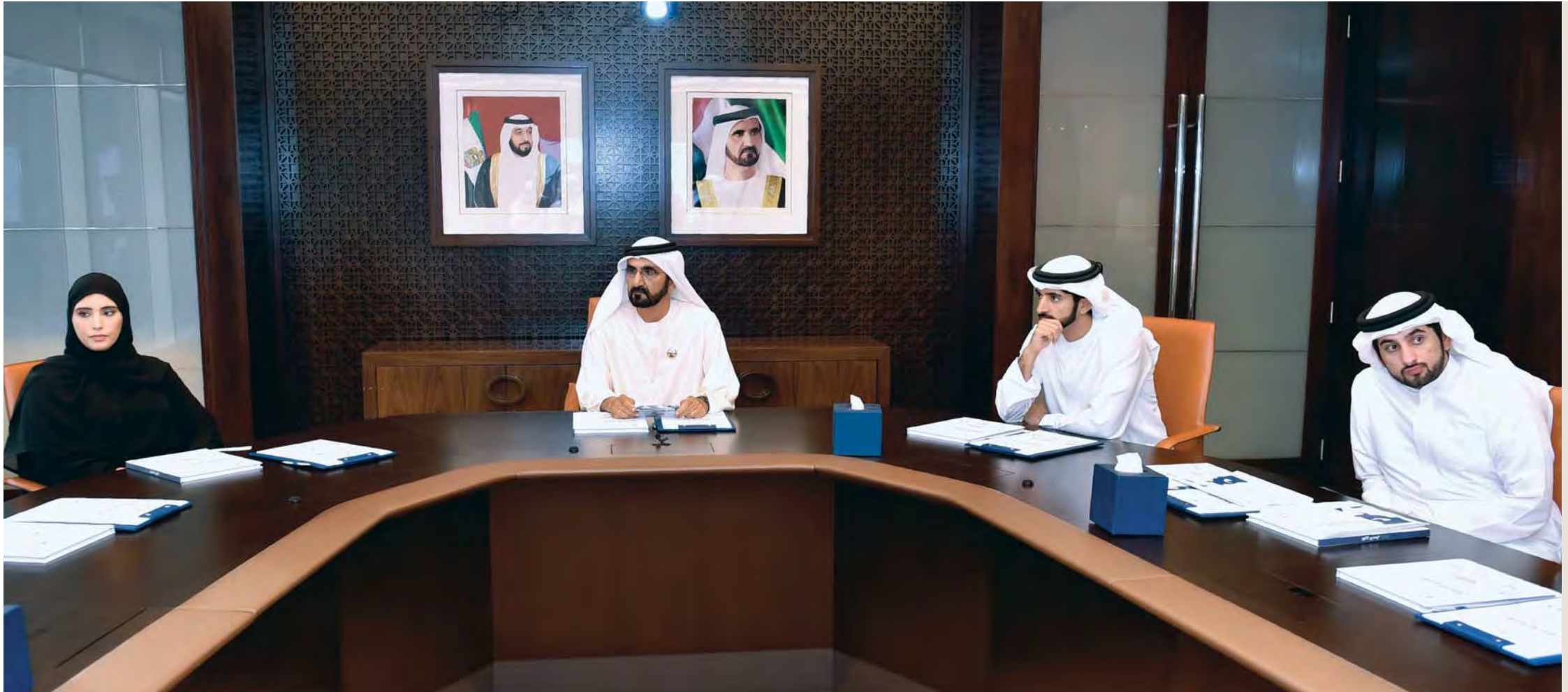
محمد بن راشد خلال الاجتماع بحضور حمدان بن محمد وأحمد بن محمد وميثاء بنت محمد