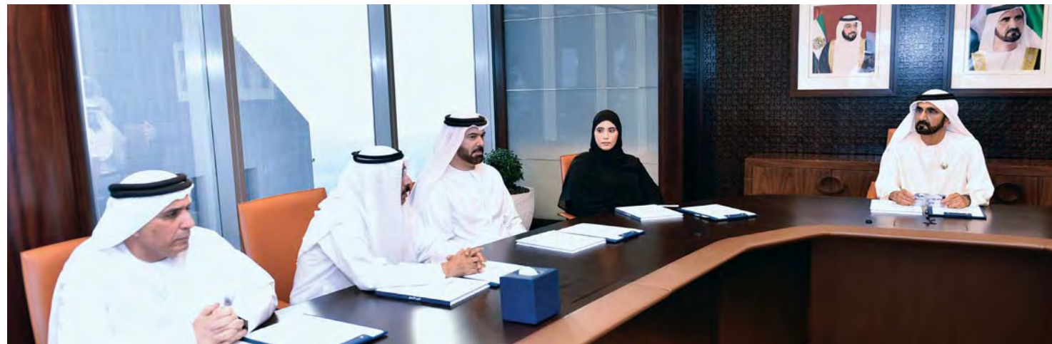
■ محمد بن راشد وميثاء بنت محمد ومحمد القرقاوي ومحمد المر ومطر الطاير

حيث تسجل بالأرقام والوقائع التأثير المستدام الذي أحدثته هذه المبادرات بما يترجم رسالة المؤسسة المتمثلة في صناعة الأمل وصياغة المستقبل وبناء عالم أكثر استقراراً ونماءً. ويقتسم نطاق أعمال مبادرات محمد بن راشد آل مكتوم العالمية في العام 2016 ضمن خمسة محاور أو قطاعات رئيسية، هي: المساعدات الإنسانية والإغاثية، والرعاية الصحية ومكافحة المرض، ونشر التعليم والمعرفة، وابتكار المستقبل والريادة، وتمكين المجتمعات. وبلغ حجم الإنفاق الكلي لمبادرات محمد بن راشد آل مكتوم العالمية أكثر من 1,5 مليار درهم في العام 2016، تم تخصيص 730 مليون درهم منها لجميع المبادرات الإنسانية والتنموية