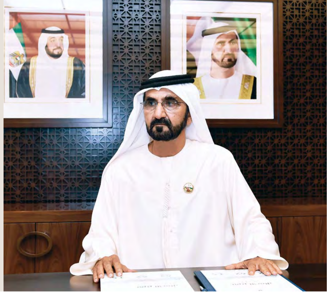
■ محمد بن راشد مترشحاً اجتماع مجلس أمناء مؤسسة «مبادرات محمد بن راشد آل مكتوم العالمية»

■ هناك حاجة ماسة لوجود عمل مؤسسي ضخم تتكامل فيه الجهود وتُحشد فيه الموارد من أجل الارتقاء بالعمل الإنساني والخيري والتنموي